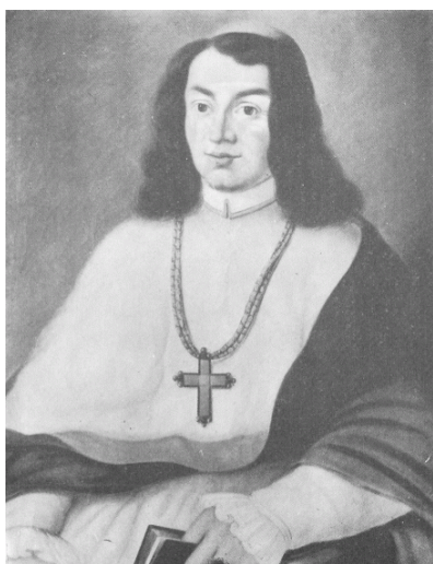
Várday Pál egri püspök

Mohácsnál meghalt 25 000 igaz magyar, hisz ők elmentek megvédeni Magyarországot. A török Budát az ország közepével együtt kirabolta, megölt 200 000 embert és 200 000 főt elhurcolt rabszolgának. Ez az akkori lakosság 10%-ával egyenlő. A megmaradtaknak újból a zűrzavar fenntartása volt az érdeke, mert aki nem vett részt az ország védelmében (komoly indokot kivéve), arra fő és jószágvesztés várt volna. Így Szapolyai Jánosra is, mert minden katonaviselt ember tudja, hogy az utolsó parancsot kell végrehajtani. Hiába hivatkozik, hogy ellentmondásos parancsot kapott, meg kellett volna néznie, hogy melyik íródott később.