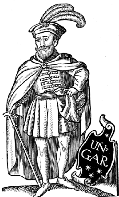
Magyar nemesi viselet a XVI. század elején