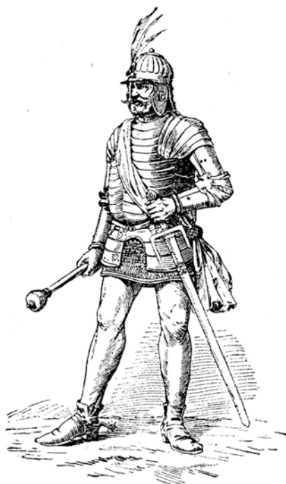
Magyar főúr hadviseletben a XVI. század elején

A következő nap, július 5-én, a király elment a gyűlésre és Werbőczit nádorrá nyilvánította, de felpanaszolta, hogy előző nap beavatkoztak a hatáskörébe, mert olyan tisztviselőket is választottak, akinek a kinevezése a király joga. „Tegye felséged, amit jónak lát, mi ebbe nem avatkozunk bele” felelték. A gyűlés ezek után százdénáros (egy aranyforintos) rendkívüli adót szavazott meg, melynek negyedrésze az új nádort illette. Azonban Werbőczyt ezt nem fogadta el, hanem azt a királynénak ajánlotta. A király még aznap távozott Hatvanból Budára.