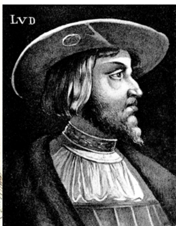
II. Lajos magyar király