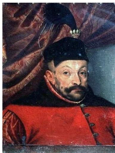
Báthory István helytartó

A hatvani országgyűléssel kapcsolatos főbb személyek és politikai csoportok rövid értékelése Mohács tükrében: