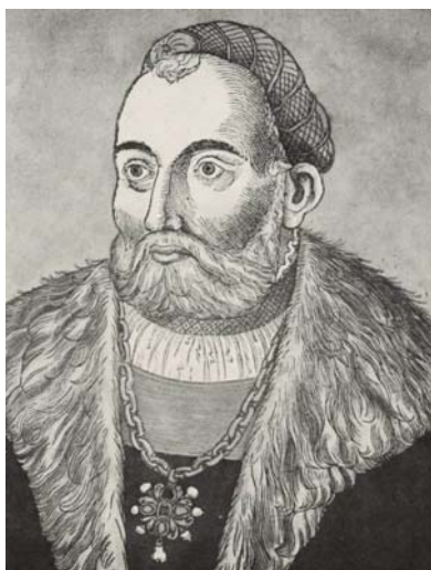
Szapolyai János erdélyi vajda